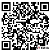
পল্লী উন্নয়ন একাডেমি, জামালপুরের টেলিটক পোর্টালে প্রবেশের QR Code