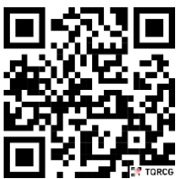
পল্লী উন্নয়ন একাডেমি, জামালপুরের ওয়েবসাইটে প্রবেশের QR Code

** শেষ তারিখ ও সময়ের জন্য অপেক্ষা না করিয়া হাতে যথেষ্ট সময় নিয়ে অনলাইনে আবেদনপত্র পূরণ ও আবেদন ফি জমা দান করিতে পরামর্শ দেওয়া হইলো।